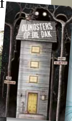
Olinosters op die Dak deur Marita van der Vyver. Illustrasies: Dale Blankenaar. (Tafelberg, R113*)